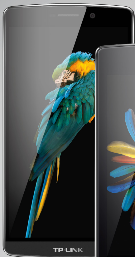
Neffos C5 Max

DAS * Tête : 0.44 W/kg, Corps : 0.70 W/kg